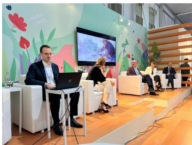
Immagini della partecipazione di LIFE CLIMATE SMART CHEFS al side event “ Climate is LIFE: Italian project solutions for fighting climate change ”, in occasione della UNFCCC COP27 di Sharm El Sheikh.