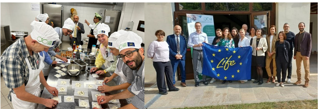
Immagini del workshop interno di progetto a Dolo (VE) con tutti i partners di LIFE CLIMATE SMART CHEFS.

Ad oggi, più di 80 progetti sono stati contattati per l'avvio di potenziali collaborazioni, e invitati a prendere parte agli eventi e alle iniziative di LIFE CLIMATE SMART CHEFS. Fra questi, in particolare, 15 progetti hanno preso parte alle tavole rotonde online della “Roadmap to Vision 2030”. Inoltre, sono state create 13 iniziative congiunte ( workshops tecnici e meetings di networking ) con i progetti europei EAT:LIFE , LIFE FOODPRINT , LIFE SCHOOLFOOD4CHANGE , FOOD TRAILS , ZEROW , COMFECTION , FOOD WAVE e con EIT FOOD, KITCHEN CONNECTION ALLIANCE e ETEN-WELZIJN FOUNDATION. Sono in via di definizione ulteriori iniziative con altri progetti europei e con le organizzazioni ESSERE ANIMALI e WWF Europe .