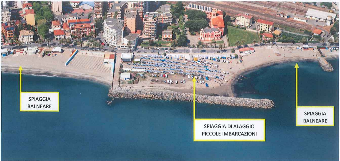
Fotogramma piano di volo Regione Liguria 2020