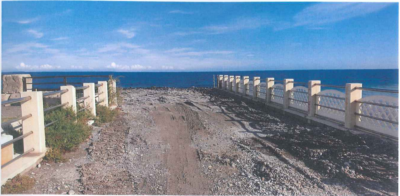
Fotogramma in radice al molo