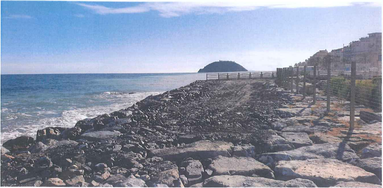
Fotogramma lato nord