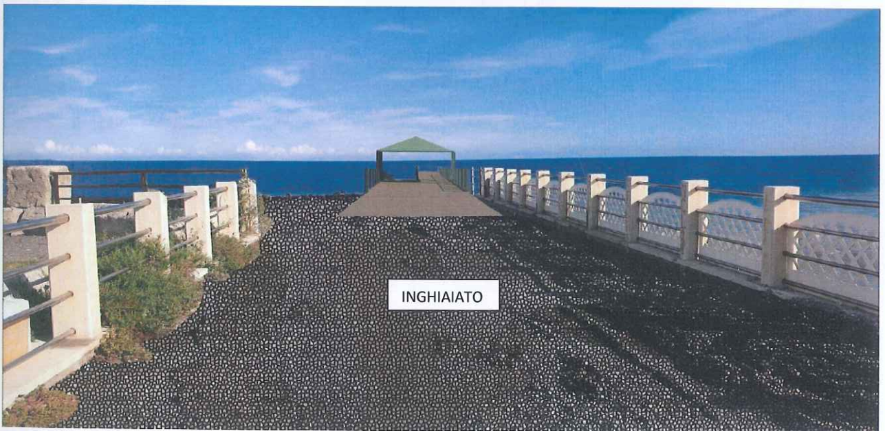
Fotomontaggio su fotogramma in radice al molo