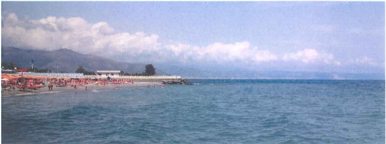
Fotogramma lato sud