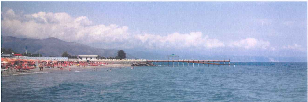
Fotomontaggio su fotogramma lato sud