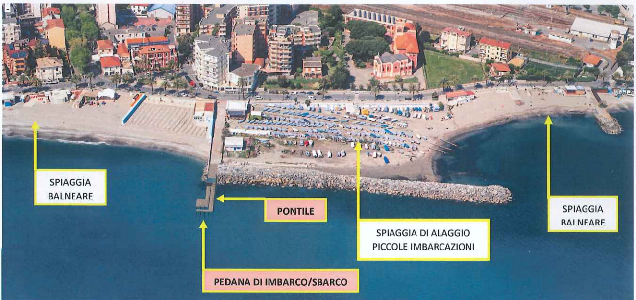
Fotomontaggio su fotogramma piano di volo Regione Liguria 2020