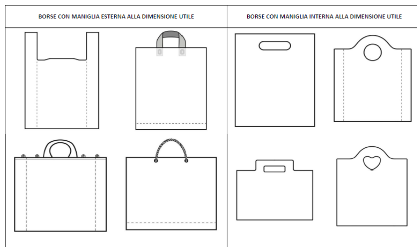
Figura 1 Tipologie di borse multiuso in PE

Questi parametri (compreso il contenuto di materiale riciclato) sono stati determinati con il contributo diretto di PolieCo e delle aziende consorziate secondo le modalità descritte al paragrafo 1.2