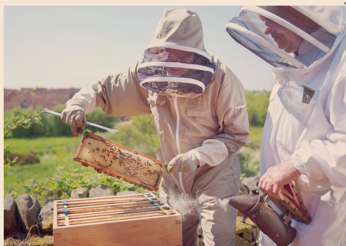
Apicoltori in montagna. «Promossa» la detassazione Irpef dei proventi per le attività che combattono l'elevata mortalità delle api. Questi insetti, preziosi per l'ecosistema, sono minacciati dai cambiamenti climatici e dall'uso di alcuni pesticidi